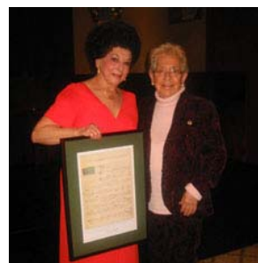
Lucero Tena (izquierda) con Alicia de Larrocha (derecha)