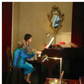
Alicia de Larrocha durante el Curso Schumann.

Gracias a la colaboración de la eminente pianista y presidenta de la AMGM, Alicia de Larrocha , se han organizado tres cursos monográficos sobre la obra pianística de Mozart , Schumann y “ Iberia ” de Isaac Albéniz . Pianistas de diferentes nacionalidades han tomado nota de los conocimientos de una gran artista que ha difundido las obras de estos y otros muchos compositores por los escenarios de todo el mundo. Está previsto que Alicia de Larrocha imparta un curso para pianistas sobre “ Música de compositores españoles ” organizado conjuntamente por la Fundación Eutherpe de León y la AMGM.