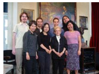
Los participantes activos del Curso Schumann con Alicia de Larrocha