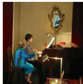
Alicia de Larrocha durant el Curs Schumann.

Gràcies a la col·laboració de l'eminent pianista i presidenta de l'AMGM, Alicia de Larrocha , s'han organitzat tres cursos monogràfics sobre l'obra pianística de Mozart , Schumann i " Iberia " d' Isaac Albéniz . Pianistes de totes les nacionalitats han pres nota dels coneixements d'una de les artistes que ha difós les obres d'aquests compositors pels escenaris de tot el món. Està previst que Alicia de Larrocha imparteixi un curs per a pianistes sobre " Música de compositors espanyols " organitzat conjuntament per la Fundación Eutherpe de León i l'AMGM.