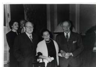
Frank Marshall, Alícia de Larrocha i Arthur Rubinstein a l'Acadèmia