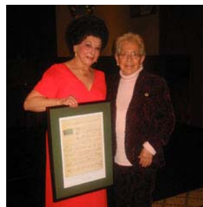
Lucero Tena (esquerre) amb Alicia de Larrocha