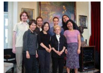
Els participants actius del Curs Schumann amb Alicia de Larrocha